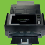
scannerbox. Mandant connect II

Smart-Scan-Lösung zum Digitalisieren von Belegen in der Kanzlei.