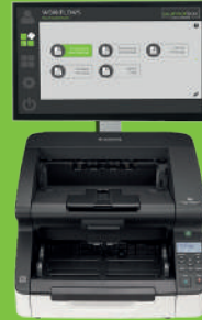
scannerbox. Kanzlei 100

Smart-Scan-Lösung zum Digitalisieren von Belegen in der Kanzlei.