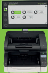
scannerbox. Kanzlei 120 PRO

Smart-Scan-Lösung zum Digitalisieren von Belegen in der Kanzlei.